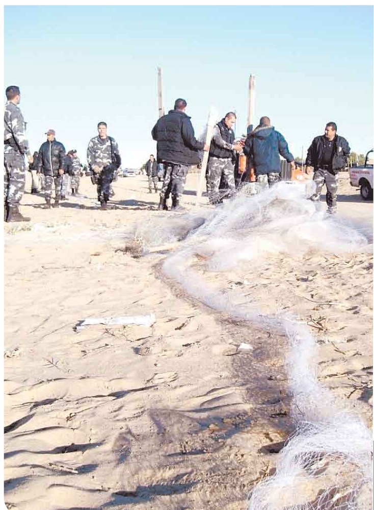
Medio centenar de elementos de la PEP y PEI desalojaron el área de invasión de la colonia Melchor Ocampo.

Los que habían ocupado el terreno con fines de vivienda se retiraron al predio en donación, no así los comerciantes, quienes se plantaron en el lugar hasta que el apoderado legal de los